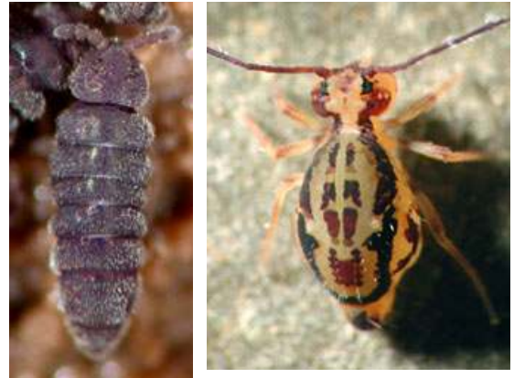
Kuva 2. Eräät hyppyhäntäislajit ovat yksivärisiä, toiset värikkään kirjavia. © David R. Maddison, Department of Entomology, University of Arizona. (With permission). http://tolweb.org/tree?group=Collembola&contgroup=Hexapoda .

Hyppyhäntäiset voivat vioittaa lähinnä vihannekasveja kuten papua, juurikasta, kaalikasveja, porkkanaa, selleriä, kurkkukasveja, sipulia, perunaa, hennettä, pinaattia ja tomaattia, mutta joskus myös koristekasveja. Vioitusjäljet muistuttavat kirppojen aiheuttamia.