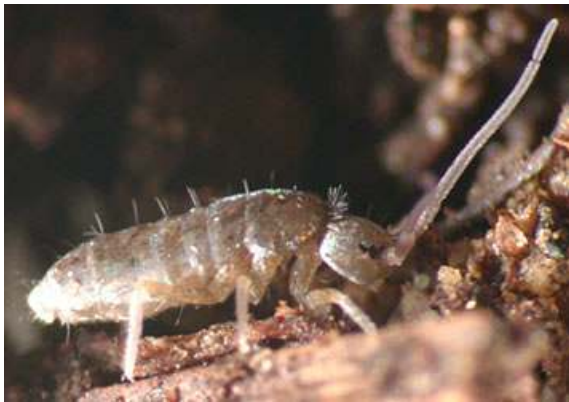
Kuva 1. Tällä hyppyhäntäisellä ei ole hyppyhankoa. © David R. Maddison, Department of Entomology, University of Arizona. (With permission). Ks. http://tolweb.org/tree?group=Collembola&contgroup=Hexapoda .

Hyppyhäntäiset ovat kosteiden paikkojen, kuten lehtikarikkeen ja kompostin eliöitä, joita elää satoja, jopa tuhansia miljoonia hehtaarilla suotuisissa oloissa. Lajista riippuen niiden väri vaihtelee valkoisesta vaalean ruskeaan, punaiseen ja violettiin; jotkut ovat kirjavia. Peräpäässä oleva hyppyhanko (furcula), jonka avulla nämä hyönteiset voivat hypähtää jopa 10 cm:n matkan, on hyppyhäntäisten tyyppituntomerkki, vaikka onkin joillain lajeilla surkastunut.