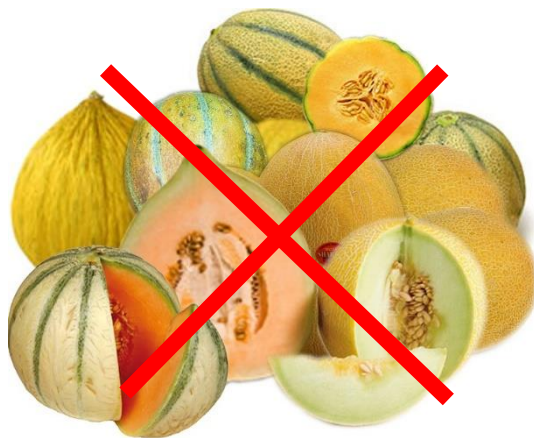
melonit melons dưa dinje