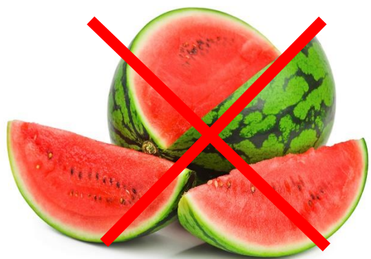
vesimeloni watermelon dưa hấu lubenica