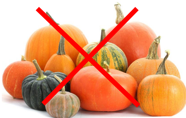
kurpitsat pumpkins bí ngô bundeve